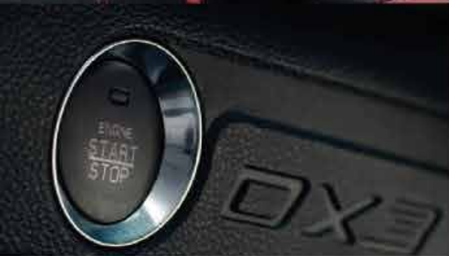
Botón de encendido