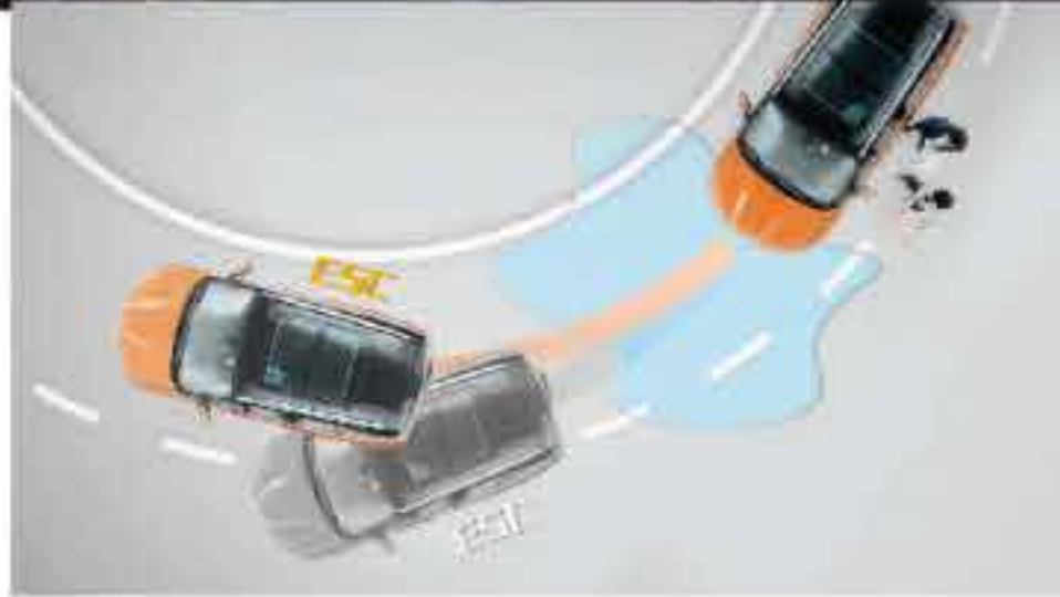
Control de estabilidad (ESC)