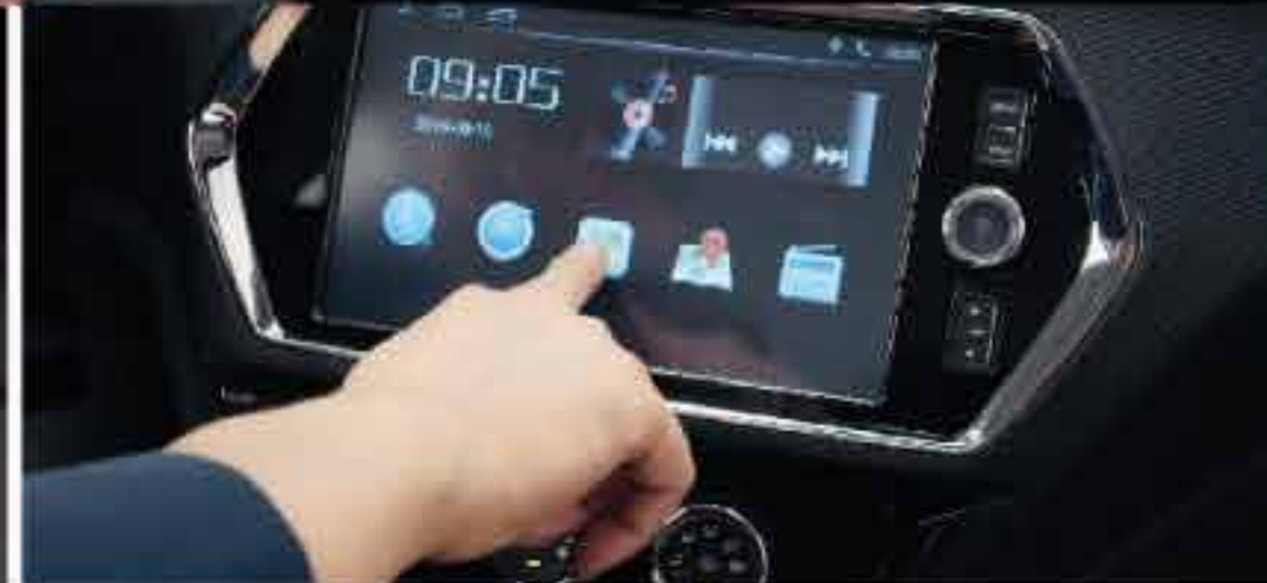
Pantalla touch 9 pulgadas